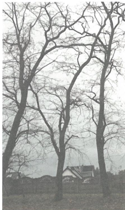
DRZEWO NR 10