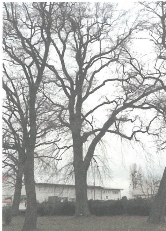
DRZEWO NR 2