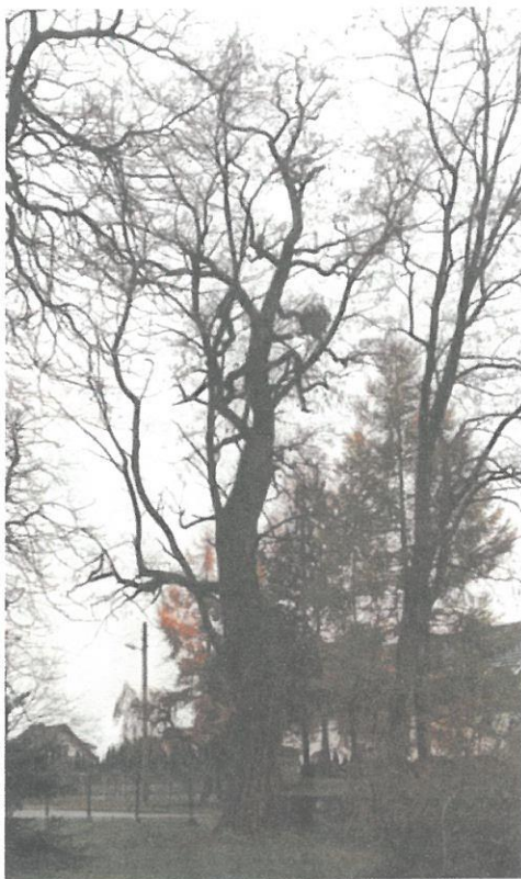
DRZEWO NR 5