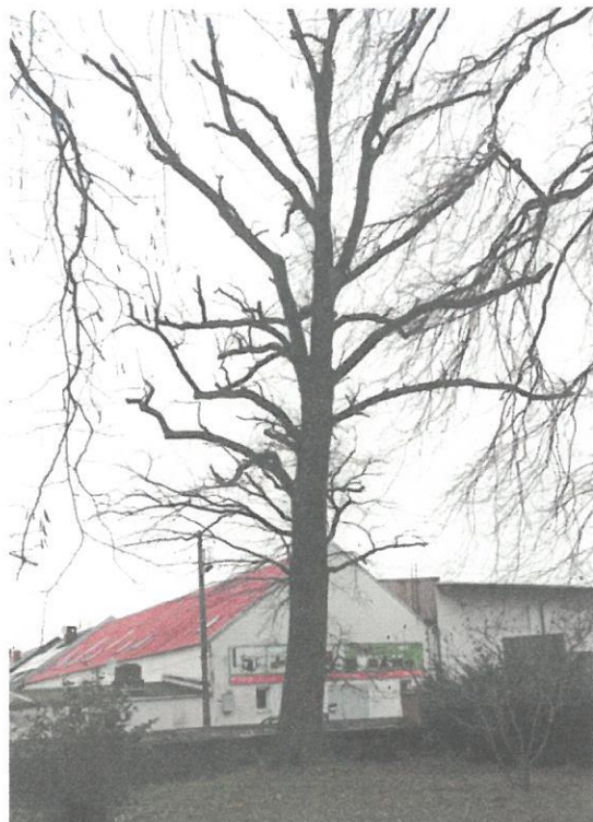
DRZEWO NR 1