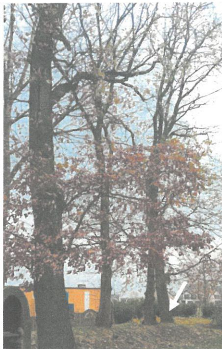
DRZEWO NR 18