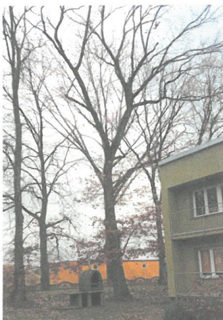
DRZEWO NR 15