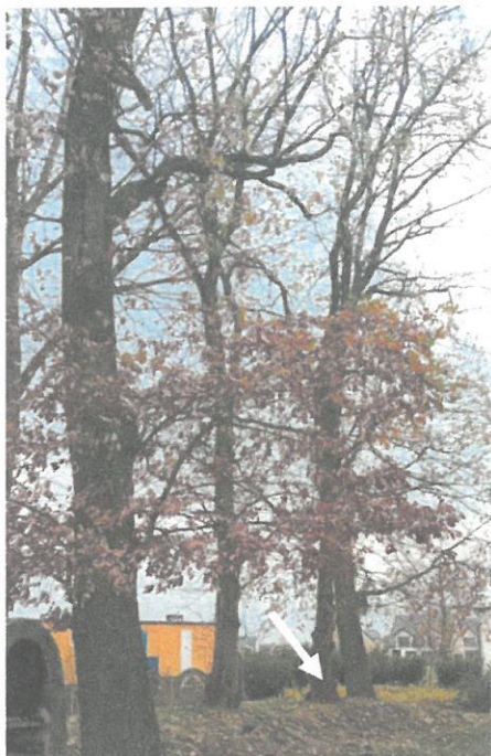
DRZEWO NR 17