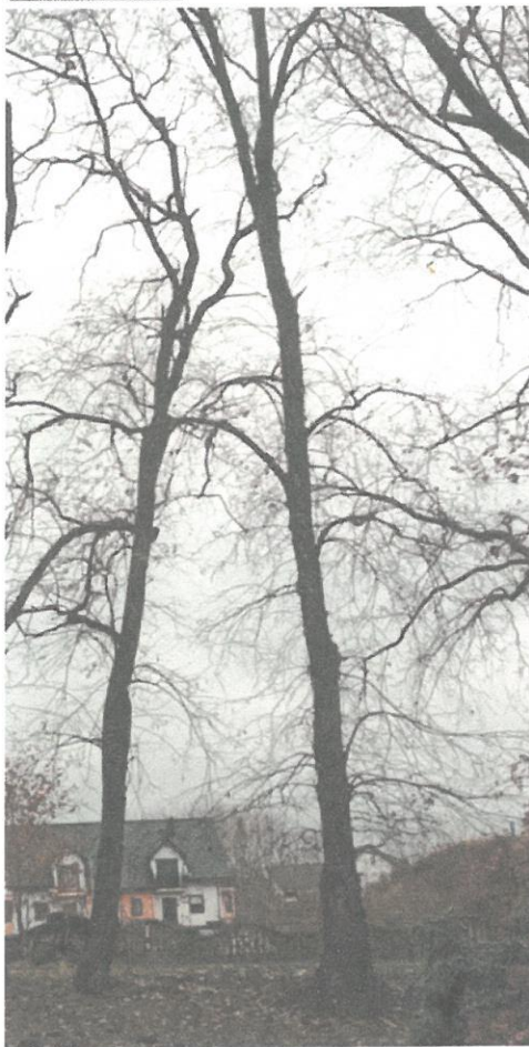
DRZEWO NR 14