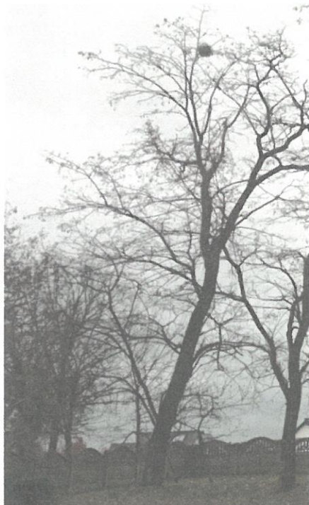
DRZEWO NR 9