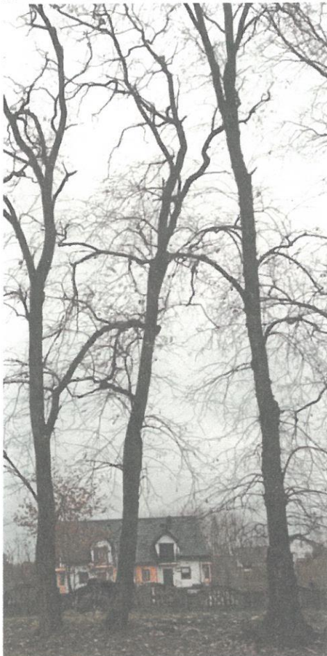
DRZEWO NR 13