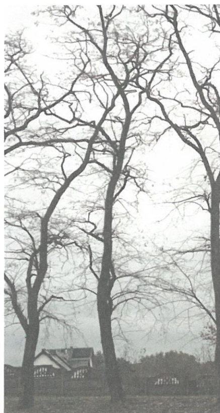
DRZEWO NR 11