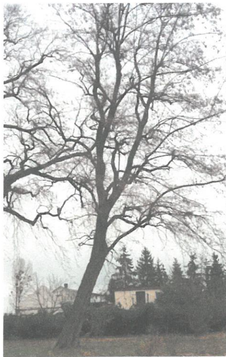
DRZEWO NR 3