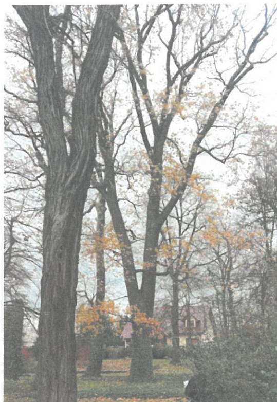
DRZEWO NR 7